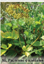
8б. Растение с плодами