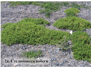
2а. Стелющиеся побеги

Однолетнее суккулентное растение до 40 см высотой. Надземные побеги сильно ветвящиеся, раскидистые, обычно стелющиеся, зелёные, блестящие, в конце лета сероватые. Листья игловидные, утолщённые, с колочей верхушкой. Цветки мелкие, зеленовато-жёлтые.