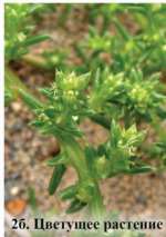
2б. Цветущее растение