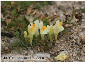
4а. Стелющиеся побеги

Многолетнее растение до 20 см высотой. Надземные побеги обычно стелющиеся, сизые от воскового налёта. Листья обратнойщевидные, суженные в черешок. Цветки небольшие, колокольчатые, поникающие, меняют окраску от ярко-розовой до голубой.