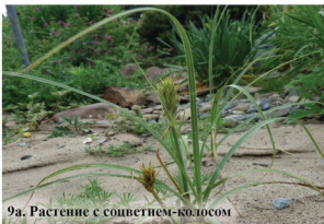
9а. Растение с соцветием-колосом

Многолетнее растение до 70 см высотой. Стебли обычно одиночные, полые, ветвятся в верхней части. Листья глянцево-зеленые, с широкими тройчатыми или дважды тройчатыми пластинами. Цветки белые или розоватые, собраны в соцветия-зонтики. Плоды узко-продолговатые, 6-10 мм длиной.