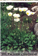
10б. Растение с цветками