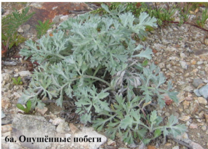
6а. Опушённые побеги