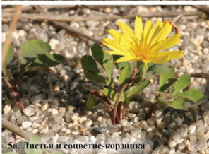
5а. Листья и соцветие-корзинка

Многолетнее растение до 20 см высотой. Надземные побеги обычно стелющиеся, сизоватые. Листья небольшие, продолговатые, сидячие. Цветки светло-жёлтые с оранжевым пятном у зева.