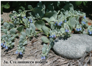
3а. Стелющиеся побеги

Многолетнее растение до 25 см высотой, образует плотные крупные куртины. Надземные побеги сильно ветвящиеся, стелющиеся. Листья мелкие, мясистые, яйцевидные, с заострённой верхушкой, расположены крест-накрест. Цветки мелкие с белыми лепестками.