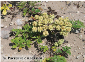
7а. Растение с плодами

Многолетнее растение до 50 см высотой. Надземные побеги беловатые из-за густого войлочного опушения. Листья перисто-лопастные или перистораздельные. Соцветия-корзинки собраны в общие узкие колосовидно-метельчатые соцветия.