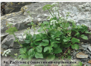
8а. Растение с соцветиями-корзинками

Многолетнее растение до 50 см высотой. Побеги прямостоячие, густо опушенные. Листья крупные, дважды перисторассеченные, прижаты к субстрату. Цветки белые или розоватые, собраны в соцветия-зонтики. Плоды крупные, округлые, из двух половинок, густо опушённые.