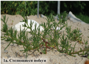
1а. Стелющиеся побеги