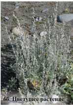
6б. Цветущее растение